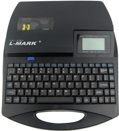
L-MARK Model LK330 with plastic keyboard 85 keys, easy to operate