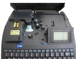
Inside printer LK330