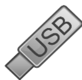
** USB Memory Only Model LK330U